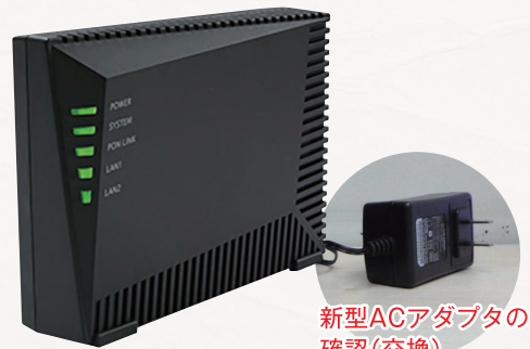
1 Gbps対応D-ONU (10Gbps対応D-ONUは別の形状となります)